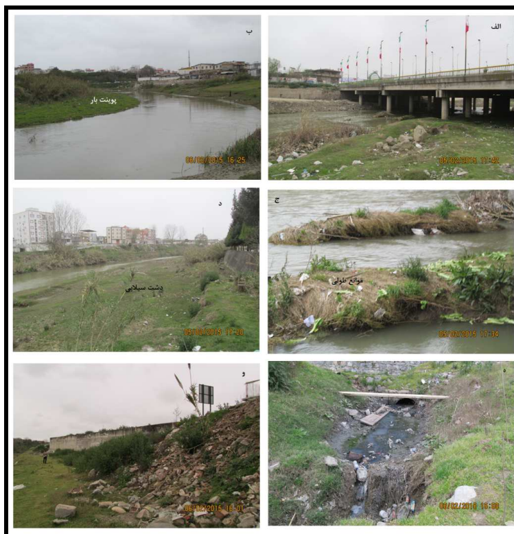
شکل ۲: تصاویر بابل رود، (الف) رسوبگذاری در پایه پل، (ب) پوینت بار، (ج) موانع طولی درون کانالی، (د) دشت سیلابی، (ه) پرشدگی کالورت، (و) تخلیه نخاله شهری و کاهش عرض رود

مطالعات یمانی و همکاران (۱۳۹۴) در بابل رود که با استفاده از روش متساوی البعد انجام شده است نشان می‌دهد که الگوی رود در بازه مورد مطالعه تغییرات کمتری را طی دوره‌های مورد بررسی تجربه نموده است. شاخص پایداری کانال رود در بازه‌های مورد مطالعه بین ۰/۱۱ تا ۰/۱۸ متغیر بوده است. با توجه به اینکه مقادیر کمتر از ۰/۲۵ نشان‌دهنده‌ی شرایط پایدار است لذا همه بازه‌ها در حالت تعادل یا پایدار قرار دارند.