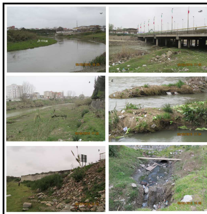
شکل ۲: تصاویر بابل رود، الف) رسوبگذاری در پایه پل، ب) پیوننت بار، ج) موانع طولی درون کانالی، د) دشت سیلابی، ه) پرشدگی کالورت، و) تخلیه نخاله شهری و کاهش عرض رود

مطالعات یمانی و همکاران (۱۳۹۴) در بابل رود که با استفاده از روش متساوی البعد انجام شده است نشان می‌دهد که الگوی رود در بازه مورد مطالعه تغییرات کمتری را طی دوره‌های مورد بررسی تجربه نموده است. شاخص پایداری کانال رود در بازه‌های مورد مطالعه بین ۰/۱۱ تا ۰/۱۸ متغیر بوده است. با توجه به اینکه مقادیر کمتر از ۰/۲۵ نشان‌دهنده‌ی شرایط پایدار است لذا همه بازه‌ها در حالت تعادل یا پایدار قرار دارند.