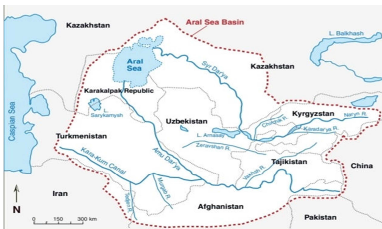
شکل ۱: محدوده‌ی دریای آرال.

رودخانه آمودریا در جنوب حوضه دریای آرال قرار دارد و طول آن ۲۵۰۰ کیلومتر و متوسط جریان سالانه آن ۳۷ کیلومتر مکعب است. از سوی دیگر، رودخانه سیردریا در شمال حوضه جاری است و طول کل آن در حوضه دریای آرال تقریباً ۲۴۰۰ کیلومتر و متوسط جریان سالانه آن نصف جریان سالانه آمودریا و ۷۹ کیلومتر مکعب است (گیبولایف ۱ و همکاران، ۲۰۱۲؛ نزلین ۲ ، ۲۰۰۴). بخش عمده‌ی مساحت حوضه زهکشی دریای آرال، تقریباً ۱۸۷۴۰۰۰ کیلومتر مربع است که توسط سیردریا و آمودریا تشکیل می‌شود. میانگین حجم آب ورودی به دریای آرال از طریق آمودریا و سیردریا به ترتیب در سال ۱۹۹۰، ۱۸،۲ و ۵،۸ کیلومتر مکعب بوده است که در سال ۲۰۱۵ به حدود ۵،۳ و ۴،۴ کیلومتر مکعب کاهش یافته است (چن ۳ و همکاران، ۲۰۲۱). آب سیردریا و شاخه‌های آن در کشورهای قرقیزستان، قزاقستان، تاجیکستان و ازبکستان جاری است، درحالی‌که آب آمودریا و شاخه‌های آن بین تاجیکستان، ترکمنستان و ازبکستان تقسیم می‌شود. دریای آرال توسط سه بیابان احاطه شده است. کیزیل کوم ۴ به معنی شن‌های سرخ در شرق، کاراکوم ۵ به معنای ماسه‌های سیاه در جنوب غربی و مویون کوم ۶ به معنی گردنه در جنوب قرار دارد. در نیم قرن اخیر به دلیل نرخ بالای تبخیر در این منطقه، سطح دریاچه آرال بزرگ ۲۳ متر و سطح دریاچه آرال کوچک ۱۶ متر کاهش یافته است. بنابراین در نتیجه دریای آرال عملاً به دریای مرده تبدیل شده است (کمالوف ۷ ، ۲۰۰۳).